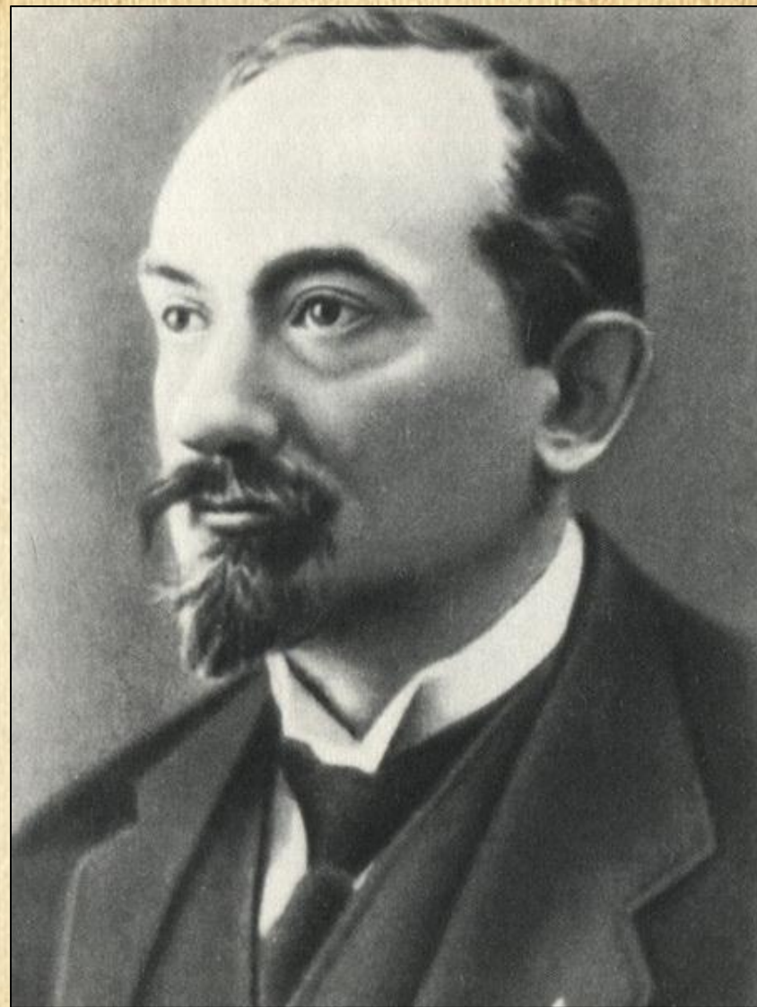
Чичерин Георгий Васильевич

В марте 1924 года глава советской дипломатии Георгий Чичерин писал в секретном послании Сталину: «При определении стоимости Северного Сахалина может быть обоснована сумма в 1500 млн зол. рублей...» В Москве прекрасно понимали, что японцы не станут платить такие огромные деньги, но в то же время переговоры о возможной продаже втянут японскую дипломатию в официальное обсуждение дальнейшей судьбы северной половины острова.