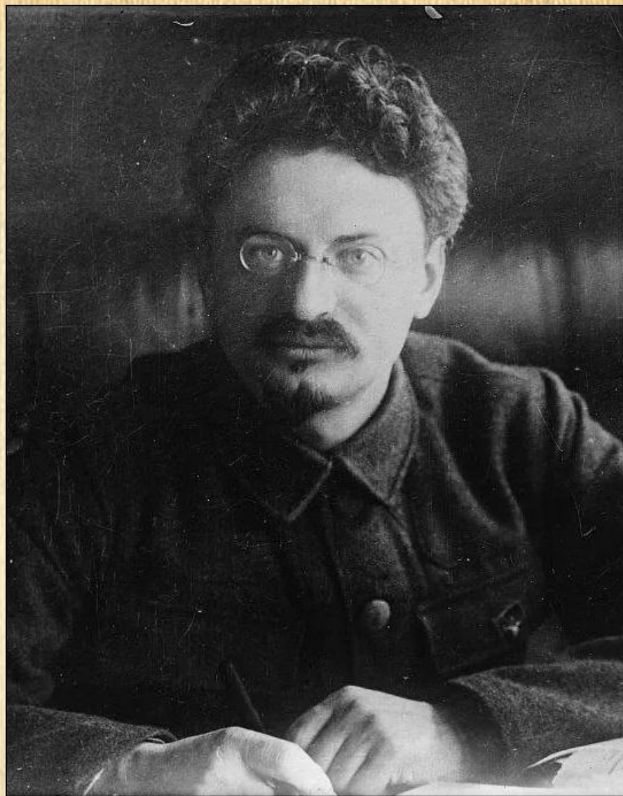
Троцкий Лев Давидович

В большевистской Москве не забывали о далёком острове. Не зря в марте 1923 года Лев Троцкий писал Иосифу Сталину: «Очень важно выяснить, есть ли у нас что-либо на Северном Сахалине, в смысле подпольной организации?..»