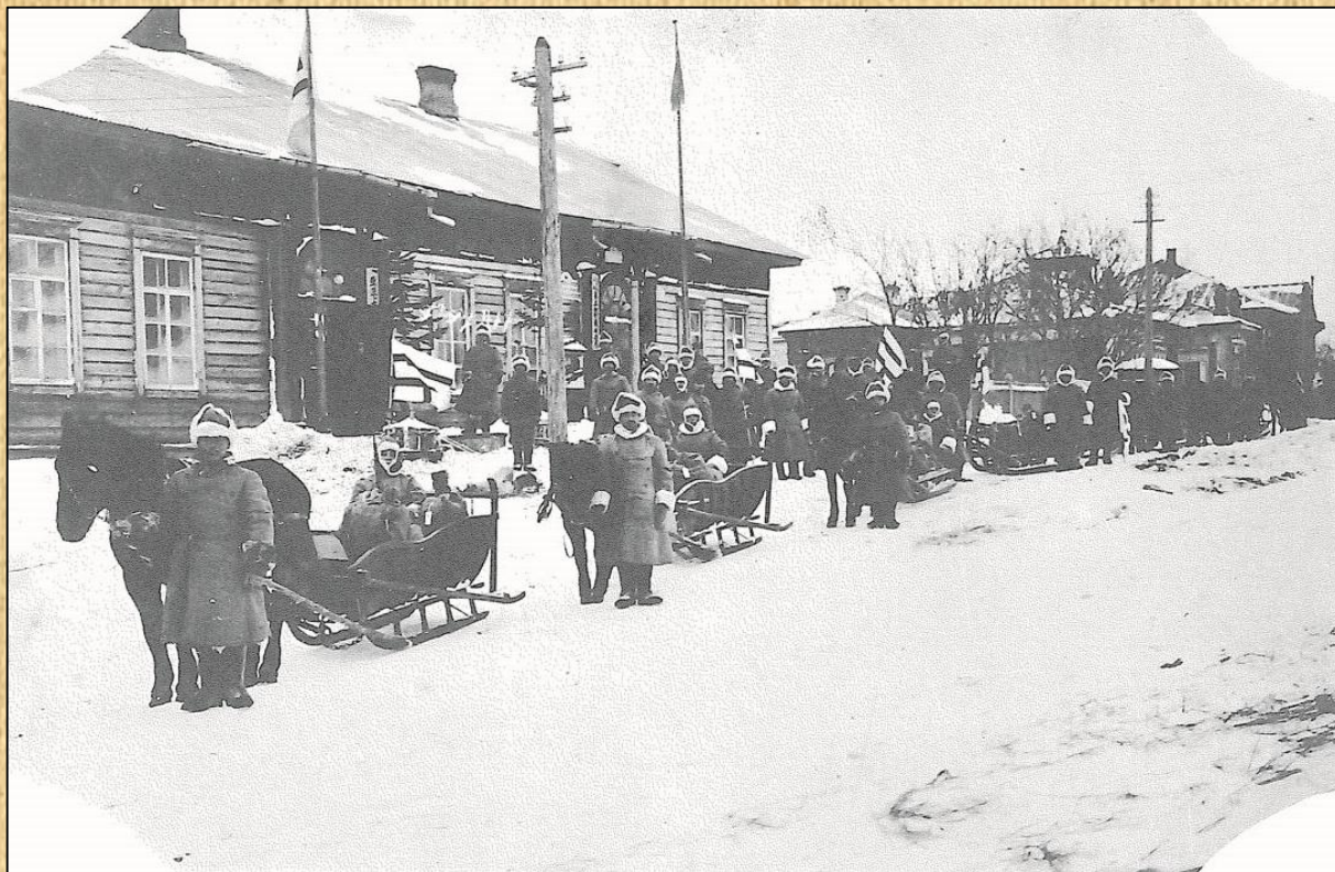
Возле почтового телеграфа в посту Александровском

Северная половина острова оказалась под властью нескольких тысяч иностранных солдат, официально именовавшихся «Японская экспедиционная армия в Сахалинской области». Оккупанты с ходу занялись не только освоением нефтяных, угольных и рыбных богатств, но и переформатированием местной жизни на свой лад. Уже осенью 1920 года в Александровске официально переименовали почти все улицы города.